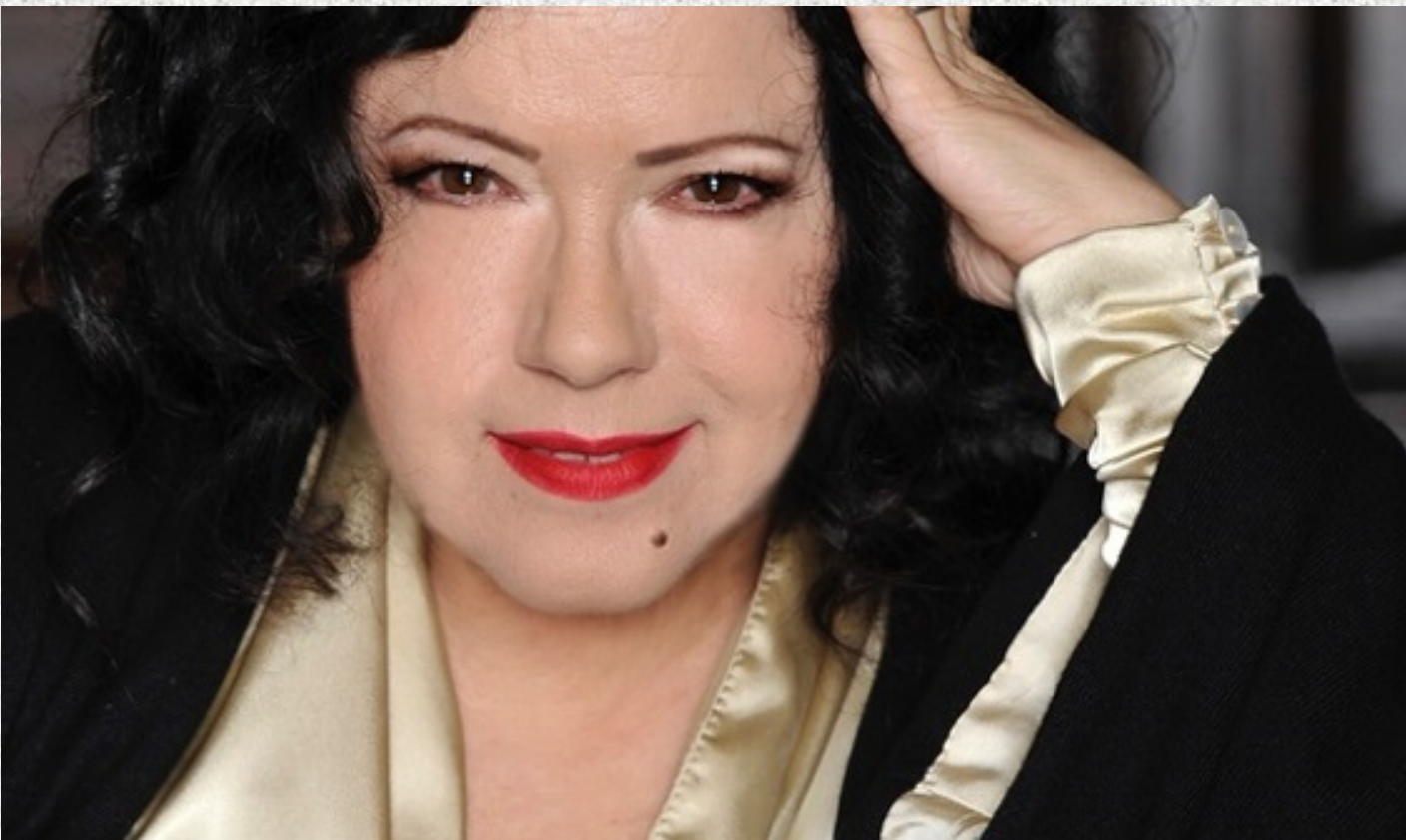
Antonella Ruggiero inaugura il 3 luglio nel Chiostro di Santa Chiara a Foggia la XIX Edizione del Festival d'arte "Apuliae"

http://toniosereno.altervista.org/ - https://capitanata.altervista.org/