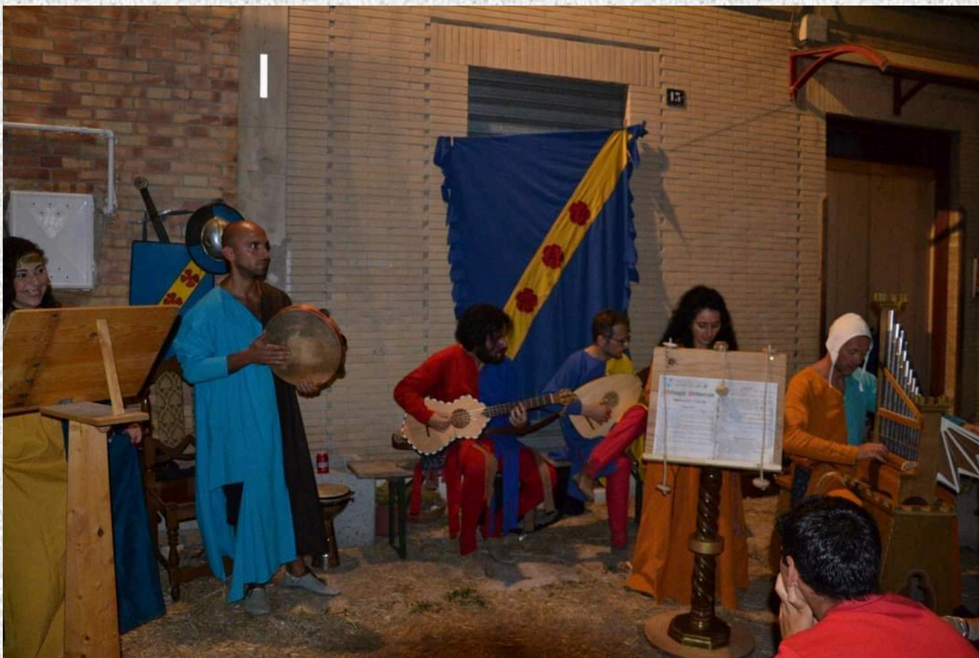
Ensamble Bona Fides

ORE 19.45 illuminazione della corte, esposizione in teche di documenti d'archivio e inaugurazione della mostra di strumenti musicali d'epoca sveva ricostruiti dall'artigiano F. Tozzi di Lucera