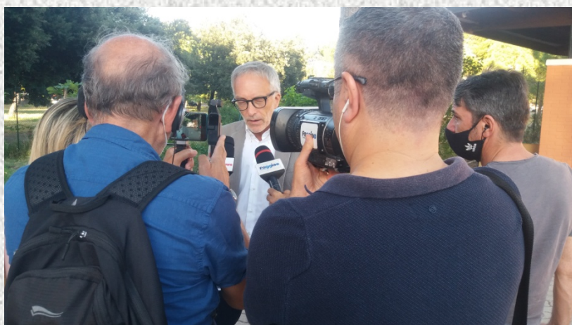
Il procuratore Ludovico Vaccaro con la stampa

Le testimonianze sono dolorose ma altrettanto efficace è la determinazione di continuare un percorso che, spesso in passato, ha lasciato soli i parenti delle vittime.